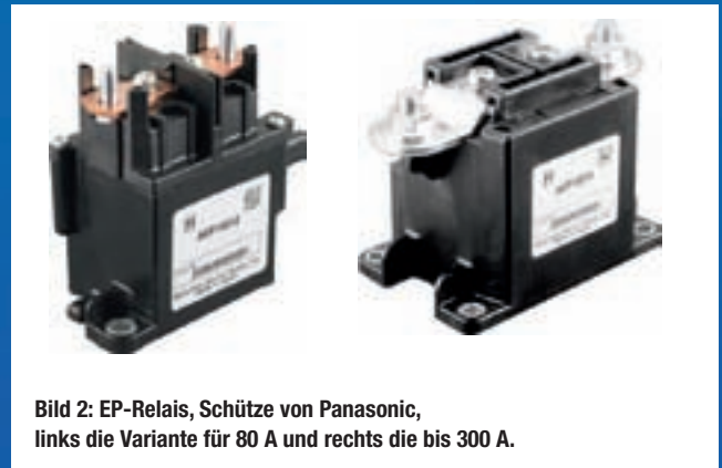
Bild 2: EP-Relais, Schütze von Panasonic, links die Variante für 80 A und rechts die bis 300 A.

Es ist kein Geheimnis, dass die Solarbranche boomt wie sonst kein anderer Geschäftszweig. Selbst die Verlängerung der Akw-Laufzeiten wird die langfristige Verbreitung dieser Technologie nicht aufhalten können. Der Trend geht eindeutig weg von Anlagen, die auf Wohnhausdächern installiert sind, hin zu großen Anlagen auf Gewerbeobjekten und in Solarparks. Aufgrund dieser Entwicklung erhöht sich die erzeugte Leistung dieser Anlagen maßgeblich.