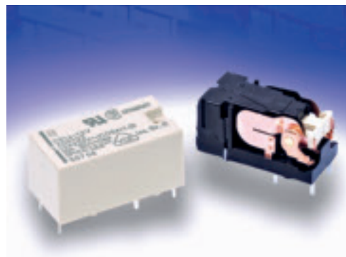
Das DE-Relais – wichtige Komponente der Installationstechnik

und ausschalten kann. Diese Anforderungen können mit dem DE-Relais in eleganter Weise gewährleistet werden. Zur Energieeinsparung kann dieses bistabile Relais durch kurze Ansteuerimpulse betrieben werden. Durch seinen kompakten Aufbau und seine großen Kriech- und Luftstrecken von mehr als 8 mm ist das DE-Relais damit in idealer Weise für den Einsatz in solchen Schaltaktoren der Installationstechnik geeignet. ■