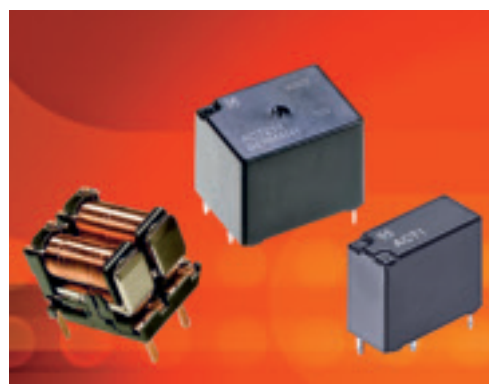
Das ACT-Relais – ein universelles Automobilrelais

Der Schaltaktor muss ein Relais enthalten, das über die Busleitung ansteuerbar und die zu schaltende Last zuverlässig und oft ein-