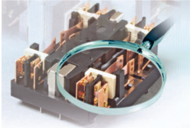
Ein Blick in das zuverlässige Doppelkontaktsystem eines modernen, zwangsgeführten Relais von Panasonic Electric Works für den Einsatz in der Sicherheitstechnik

Mitte der 70er-Jahre war der allgemeine Pessimismus für die Zukunft elektromechanischer Relais langsam einer realistischeren Betrachtungsweise gewichen. Waren es doch die in den 60er-Jahren auf den Markt drängenden Transistoren, verbunden mit der Leiterplattentechnik, und erst recht die darauf folgenden ICs, die den damals konventionellen Relais keine Zukunftsaussichten mehr gaben. Diese Einschätzung war richtig, zumindest für die damals weit verbreiteten Rundrelais, die einfach viel zu groß und bezüglich des Materialeinsatzes für die meisten Anwendungen überdimensioniert waren. Sie galt aber auch noch für die damals relativ modernen, kammbetätigten Relais. Auch diese waren für den Leiterplatteneinsatz immer noch zu groß.